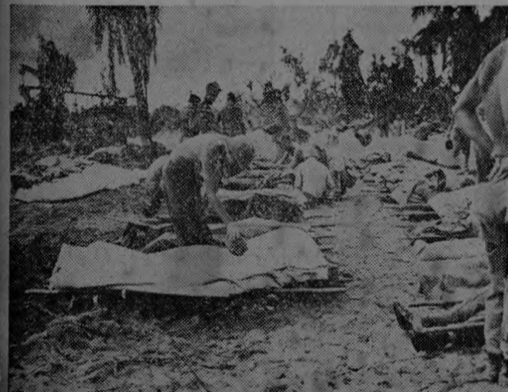
Soldados de infantería de marina de los Estados Unidos identifican y cuentan los cadáveres de sus compañeros de armas muertos en la lucha contra los japoneses antes de enterrarlos en la selva. Varios combates cuerpo a cuerpo fueron necesarios para eliminar a la guarnición japonesa de la isla.